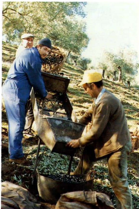
En la criba.

El manijero se levanta antes que la cuadrilla para tenerles preparada la candela. Dirige todas las faenas, la hora del comienzo y el fin de la jornada. En cualquier riña o discusión entre los componentes de la fanaguería él será el juez e impone las paces.