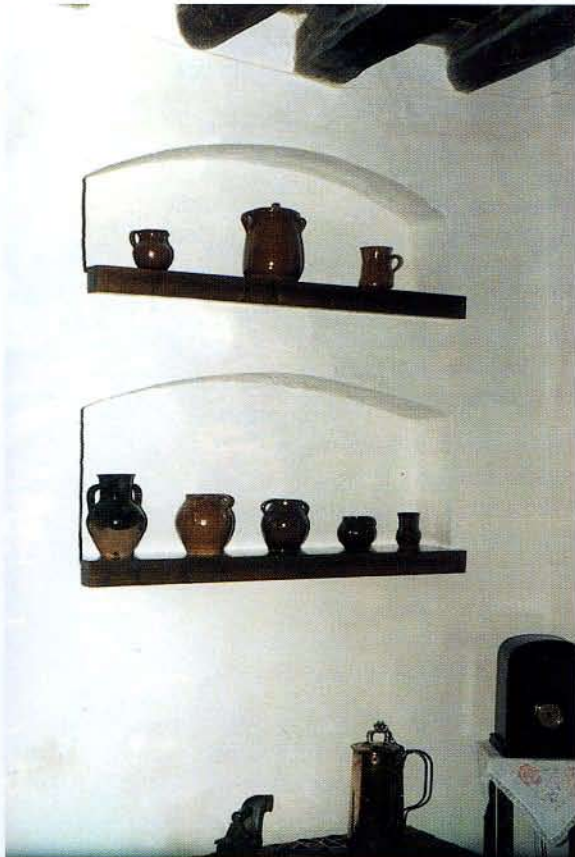
Cantarera de adorno. Añora.